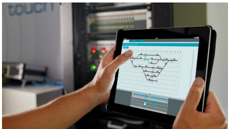
图 3: Frauscher_FAMS_FDS. jpg