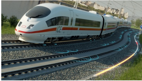
图 1: Frauscher_FTS_TrainTracking. jpg